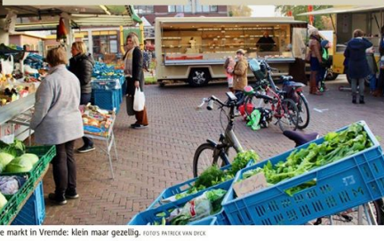
De markt in Vremde: Klein maar gezellig.